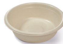
6.15寸小圆碗 (覆膜可选)